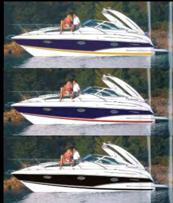
Широкая полоса по борту