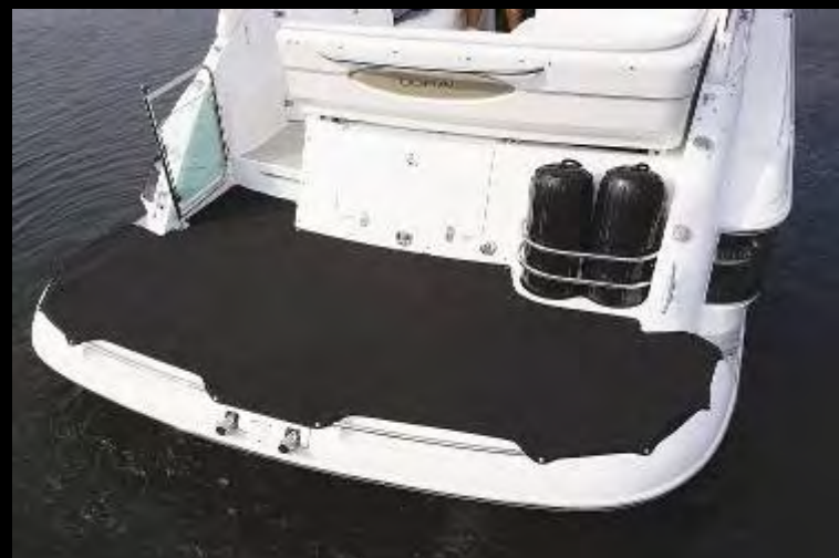
Тент на платформу для купания