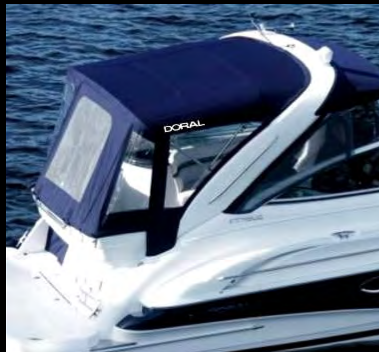
Ходовой тент полностью закрывает пространство кокпита